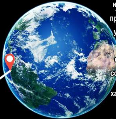
Уровень естественной-абсолютной технологии-природы Бога. (размер планеты больше чем своя)

Хаос творится только в голове неверного-отклоненного, не понимающий абсолютную идеальность - совершенность и технологичность - разумность природы - естества - абсолютной технологии, абсолютность, уровень и масштаб технологии которого ему не понять из за микроскопичности уровня своего разума и размера относительно локальной части бытия, что поверхность совершенства-природы кажется ему из за своей логичной процедурности иллюзорно хаотичной. Естественный разум натуральных созданий, превосходящий любой ИИ и мобильное самопроизводство-репродукция естественных систем - один из самых явных фактов абсолютной технологичности естества Бога-Единого Вселенского Метасоциума.