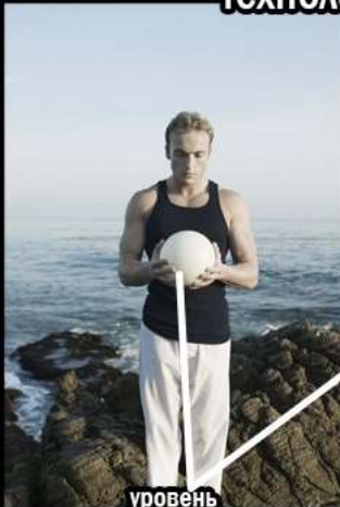
уровень искусственной-производной(от естественной) технологии

— «совершенны» и «технологичны» чем «хаотичная» природа, ибо искусственное имеет гладкую и ровную форму и структуру, и она «умнее» - «логичнее» чем обычное природное.