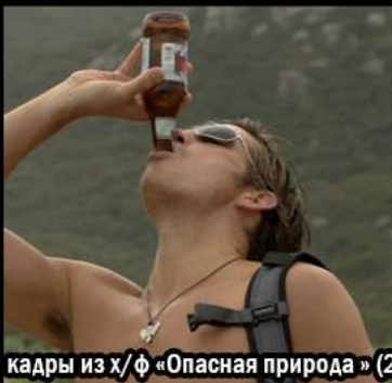
кадры из х/ф «Опасная природа» (2008)

Хаос творится только в голове неверного-отклоненного, не понимающий абсолютную идеальность - совершенность и технологичность - разумность природы - естества - абсолютной технологии, абсолютность, уровень и масштаб технологии которого ему не понять из за микроскопичности уровня своего разума и размера относительно локальной части бытия, что поверхность совершенства-природы кажется ему из за своей логичной процедурности иллюзорно хаотичной. Естественный разум натуральных созданий, превосходящий любой ИИ и мобильное самопроизводство-репродукция естественных систем - один из самых явных фактов абсолютной технологичности естества Бога-Единого Вселенского Метасоциума.